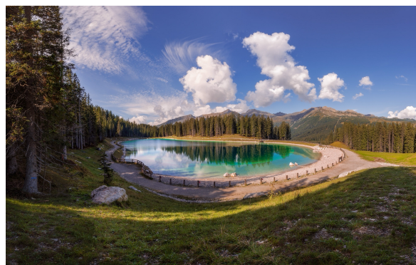
Lago artificiale Montagnoli- Madonna di Campiglio

Questi invasi avrebbero molteplici funzioni: